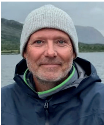
Bård Andresen Vestfold og Telemark fylkeskommune